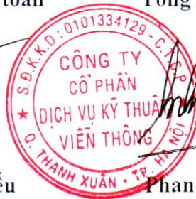
Phan Sỹ Kiên

Chứng chỉ ISO 9001:2008 (được cấp bởi TUV-NORD ngày 10/04/2015).